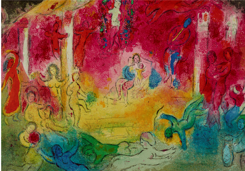
Chagall – Tempel und Geschichte des Bacchus

Mit dieser Ausstellung richtet das Museum Folkwang Essen den Blick auf Paris als „Zentrum für die Produktion originalgrafischer Kunstwerke“.