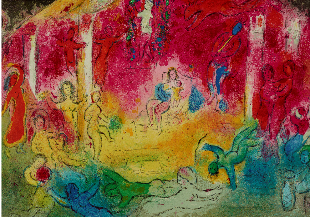
Chagall – Tempel und Geschichte des Bacchus

Mit dieser Ausstellung richtet das Museum Folkwang Essen den Blick auf Paris als „Zentrum für die Produktion originalgrafischer Kunstwerke“.